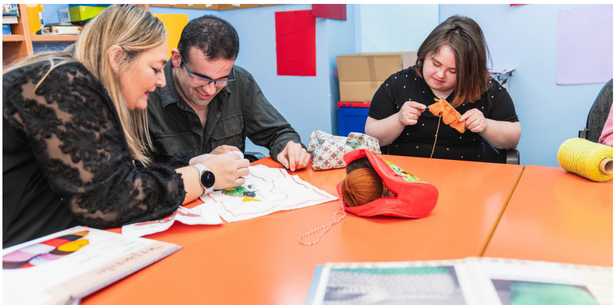
Giáo viên dạy may vá cho người lớn bị khuyết tật tâm thần

Điều này áp dụng cho bất kỳ người phụ thuộc là người lớn khuyết tật nào đã được chẩn đoán mắc khuyết tật về tâm thần hoặc thể chất. Tình trạng khuyết tật cần được ghi lại (xem bên dưới).