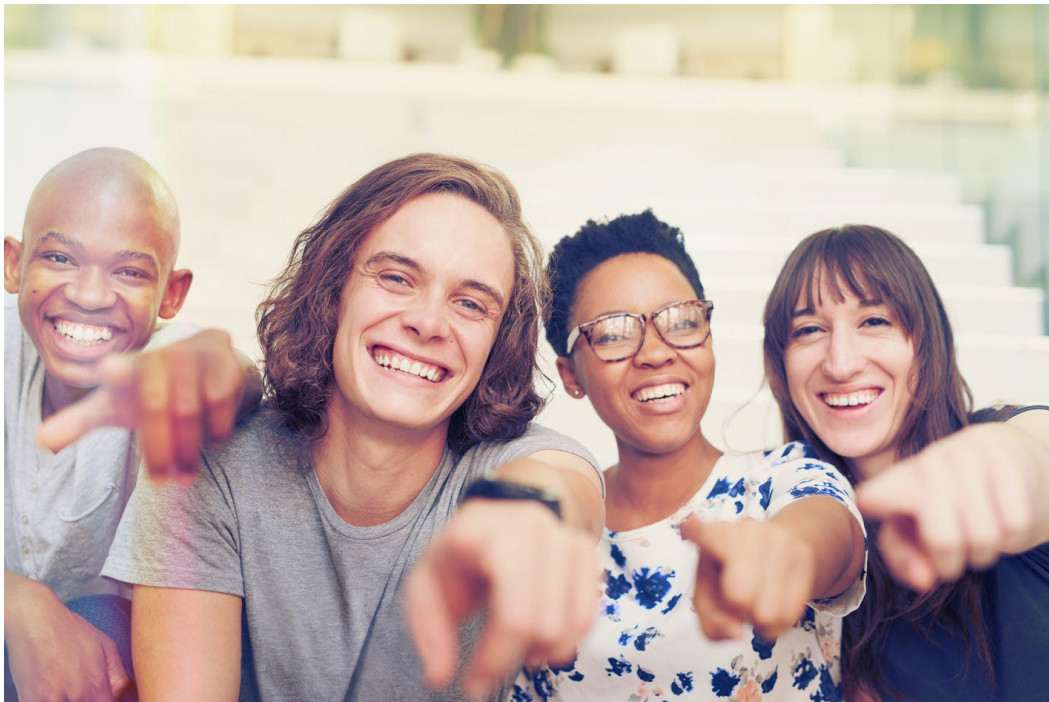
Ảnh chân dung một nhóm người cùng nhau chỉ tay về phía trước