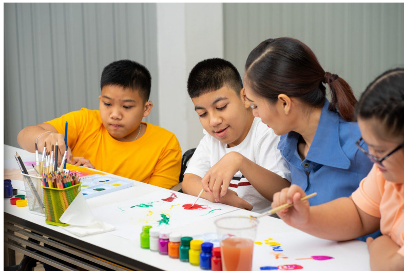
Li gason andikape ak yon fi fi otis k ap aprann kolorye/penn lekòl la