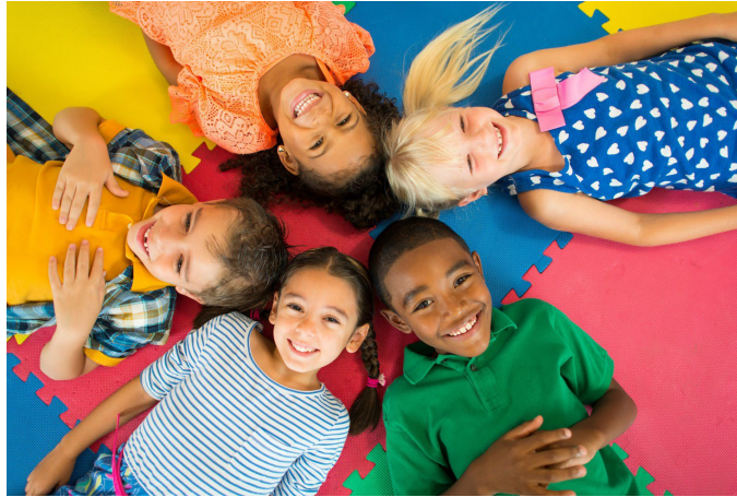
Nhóm trẻ em đa chủng tộc đang nằm và nhìn lên máy ảnh

Các nhà cung cấp dịch vụ nên liên hệ với các Tổ Chức Quản Lý Chăm Sóc (Managed Care Entity, MCE) là bên đang quản lý quyền lợi ABA thông qua MassHealth: MBHP/Carelon , Tufts Health Public Plans , và Optum Behavioral Health . Để biết thêm thông tin hoặc để được hỗ trợ, vui lòng liên hệ với Trung Tâm của chúng tôi.