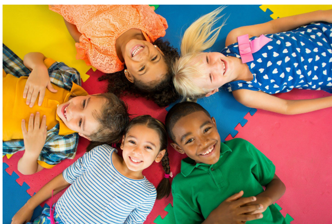
Nhóm trẻ em đa chủng tộc đang nằm và nhìn lên máy ảnh

ARICA không ảnh hưởng đến các dịch vụ giáo dục được cung cấp theo Kế Hoạch Hỗ Trợ Gia Đình Cá Nhân (Individual Family Support Plan, IFSP), Kế Hoạch Giáo Dục Cá Nhân (Individual Education Plan, IEP) hoặc Kế Hoạch Dịch Vụ Cá Nhân (Individual Service Plan, ISP). Các công ty bảo hiểm không bắt buộc phải thanh toán cho các dịch vụ trong trường học. Ngược lại, các trường học không được yêu cầu cha/mẹ tiếp cận bảo hiểm tư nhân cho các dịch vụ mà trẻ em có quyền được nhận thông qua trường học. Có thể tìm thêm thông tin trong Tư Vấn Hành Chính SPED 2012-1-Luật về Bảo Hiểm cho Bệnh Tự Kỷ (pdf).