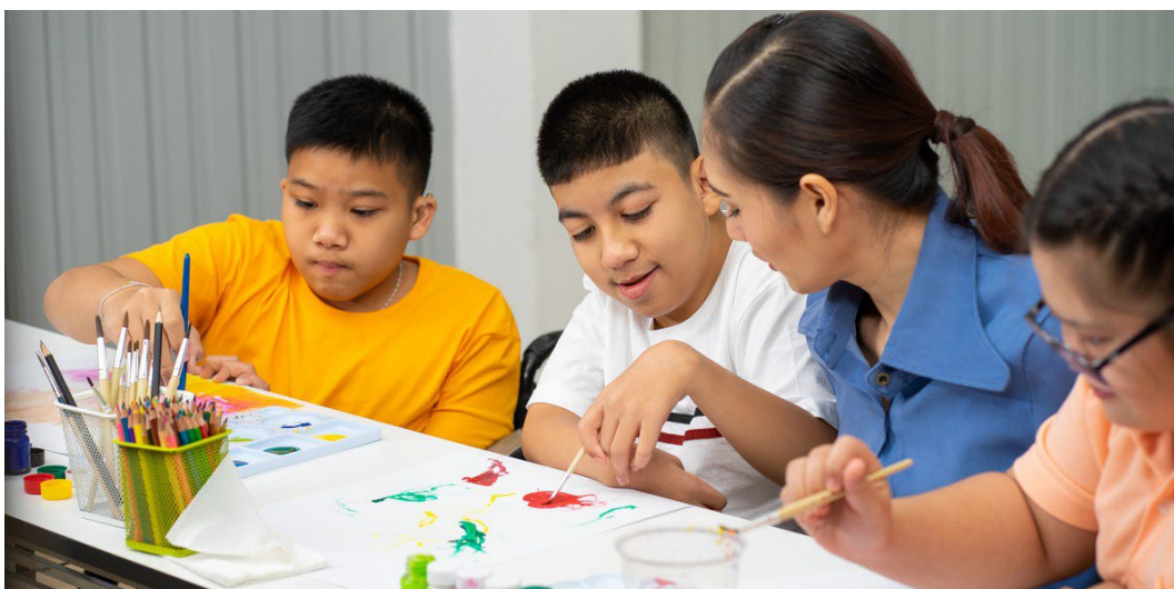
Các bé trai khuyết tật và bé gái tự kỷ người châu Á đang học tô màu/vẽ tranh ở trường

Nếu quý vị có bảo hiểm thông qua hãng sở của mình, hãy hỏi bộ phận Nhân Sự xem hợp đồng bảo hiểm của quý vị có phải là tự tài trợ không. Nếu quý vị có chương trình tự tài trợ, hãy hỏi xem quý vị nên liên hệ với ai để biết thông tin cụ thể về khoản bao trả cho liệu pháp điều trị tự kỷ.