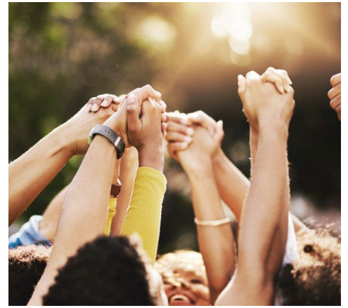
Ảnh chụp cắt lớp một nhóm người không nhận dạng được đang nắm tay nhau